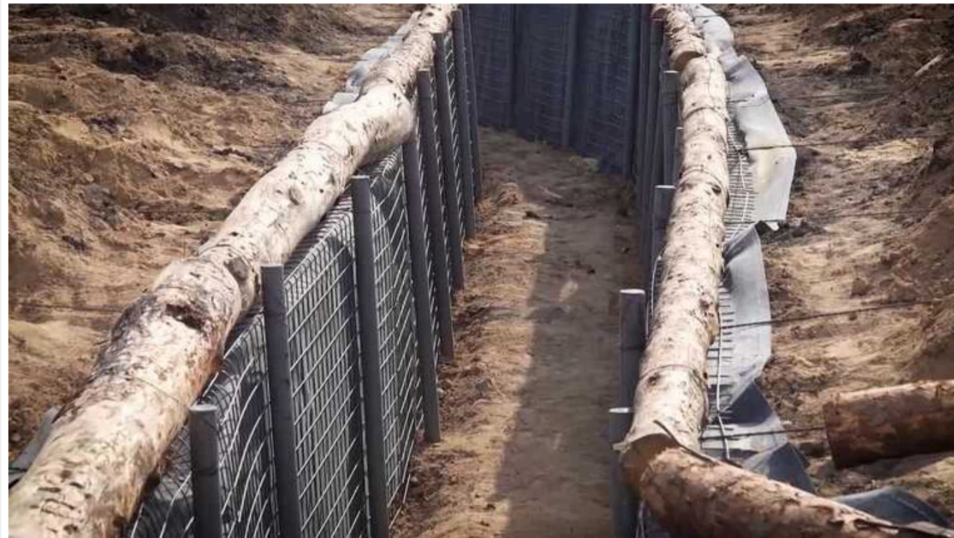
Сотні мільйонів гривень, імовірно, могли вкрати на будівництві фортифікацій у Харківській області, – ЗМІ

Департамент Харківської ОВА для оборонних закупівель обирає щойно зареєстровані ноунейм фірми та ФОПи.