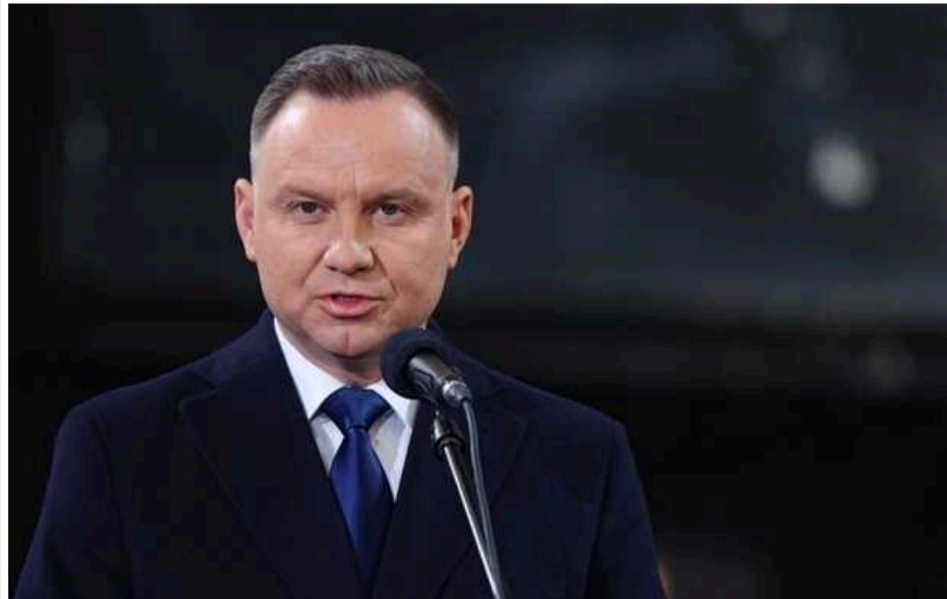
Дуда відповів, коли Польща посприяє вступу України в Євросоюз

Процес вступу України та Молдови до Європейського союзу не може бути "лише обіцянкою" і "тривати вічно". Президент Польщі Анджей Дуда закликав активізувати інтеграцію обох держав до ЄС.