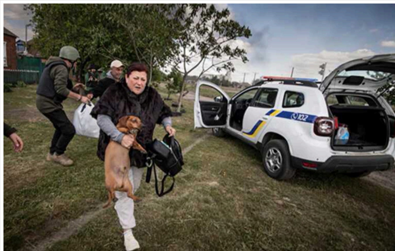
Мешканці Вовчанська тікають у Харків із надією, що окупанти туди не дійдуть

Люди, які пів року прожили під "руським міром" у 2022-му, здригаються від думки про повернення росіян.