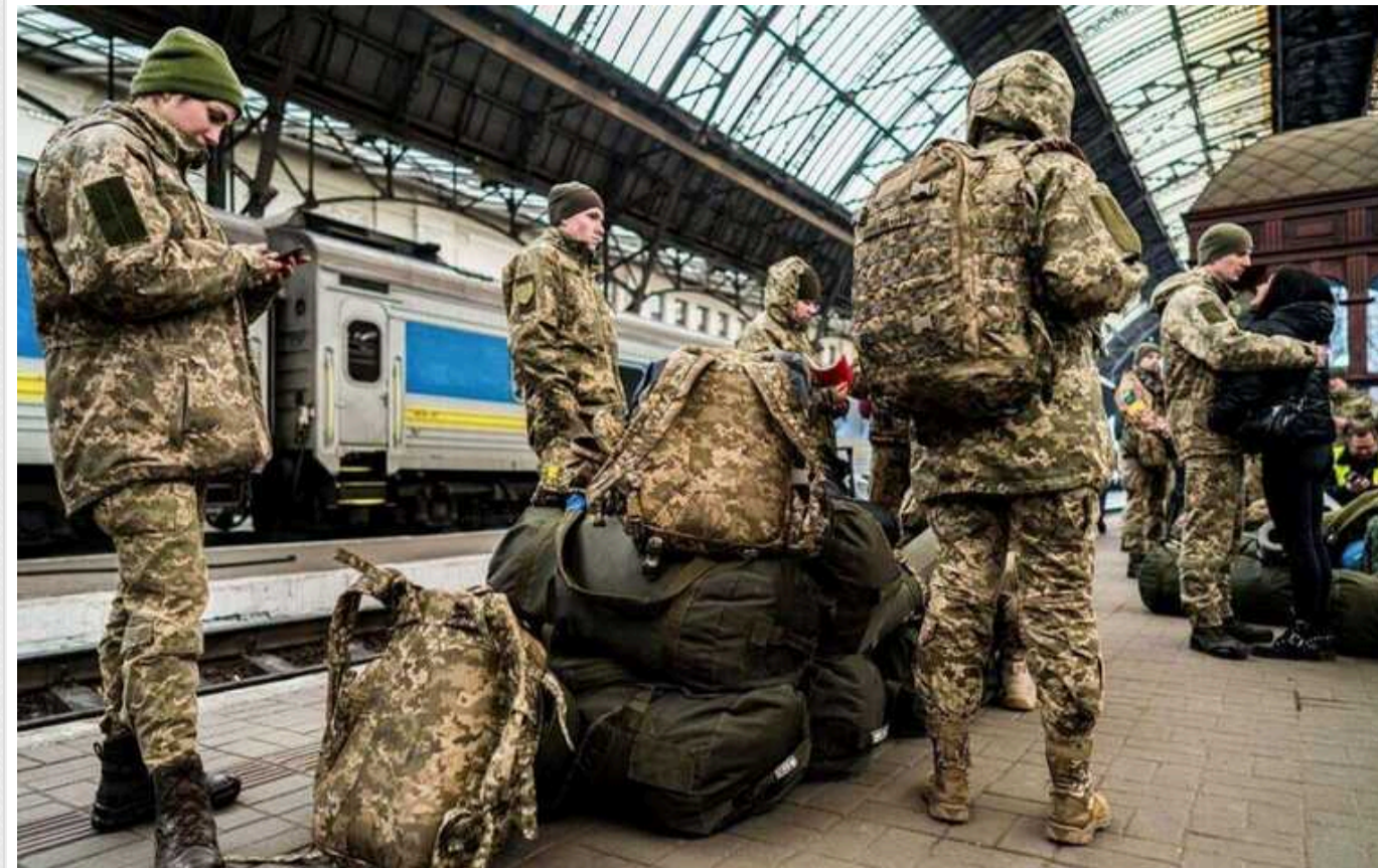
Нардеп розповів, чому парламент "поховав" ідею демобілізації і до чого тут Сирський

Військове керівництво України переконало депутатів не підтримувати поправку про демобілізацію в мобілізаційному законопроекті.