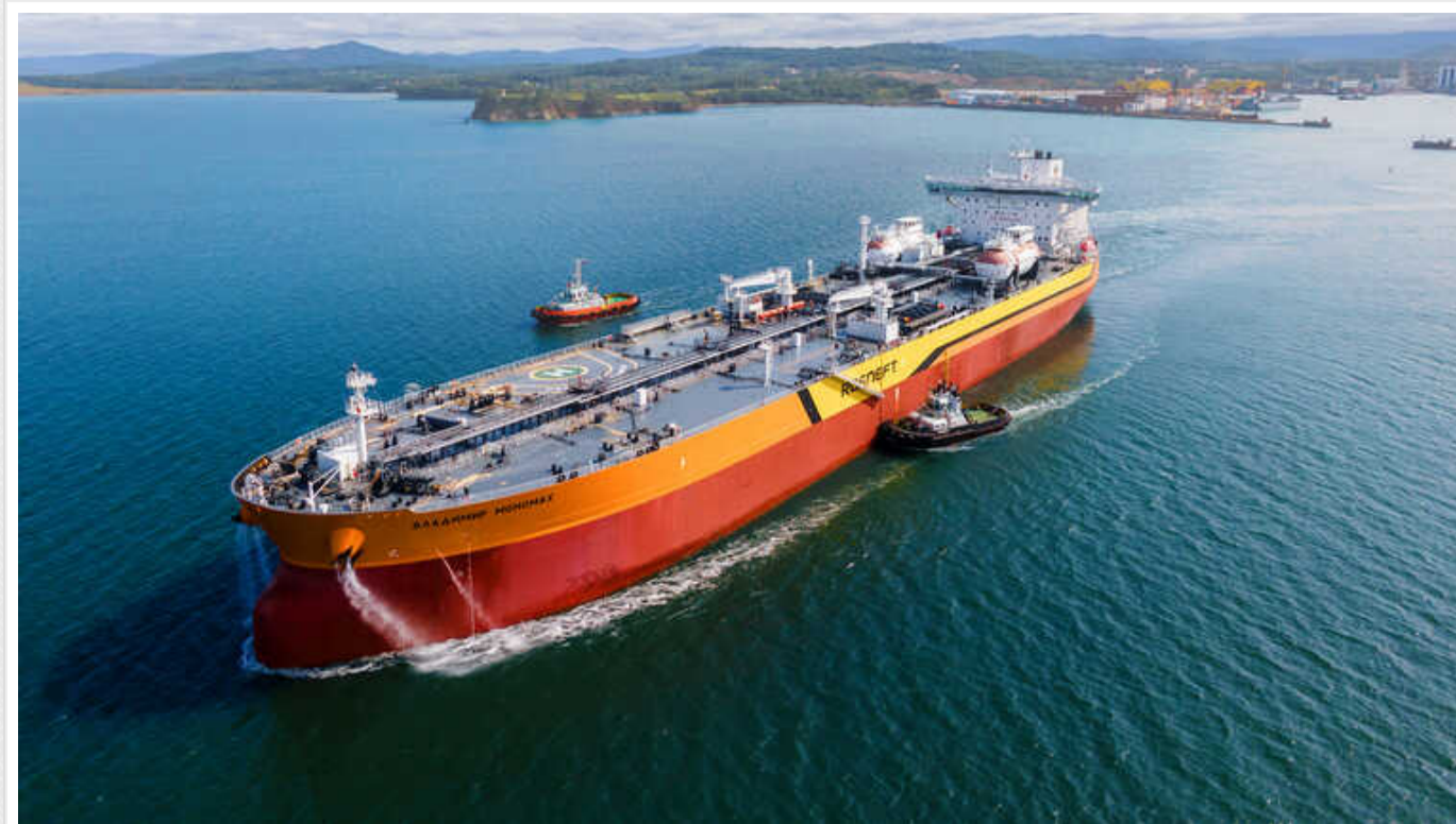
Reuters : Російському Газпрому не вистачає танкерів для експорту СПГ

Компанії "Газпром" не вистачає танкерів для експорту російського скрапленого природного газу, тому їй доводиться використовувати для цього специфічні установки.