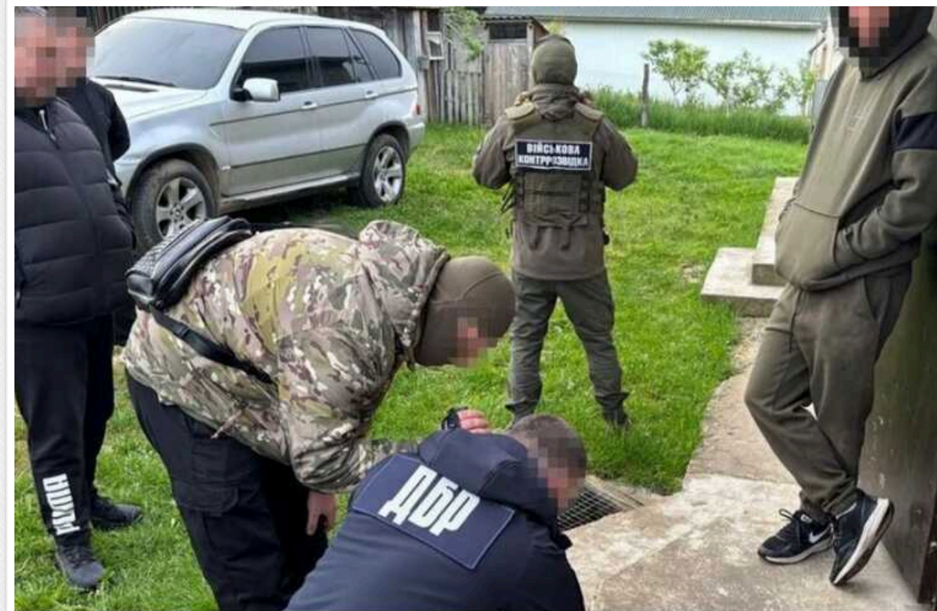
ДБР на Буковині ліквідували ще один канал переправлення ухилантів за кордон

Державне бюро розслідувань на Буковині припинило діяльність ще одного каналу незаконного переправлення чоловіків мобілізаційного віку за кордон. Внаслідок спецоперації затримано правоохоронця, який виявився співучасником цієї схеми.