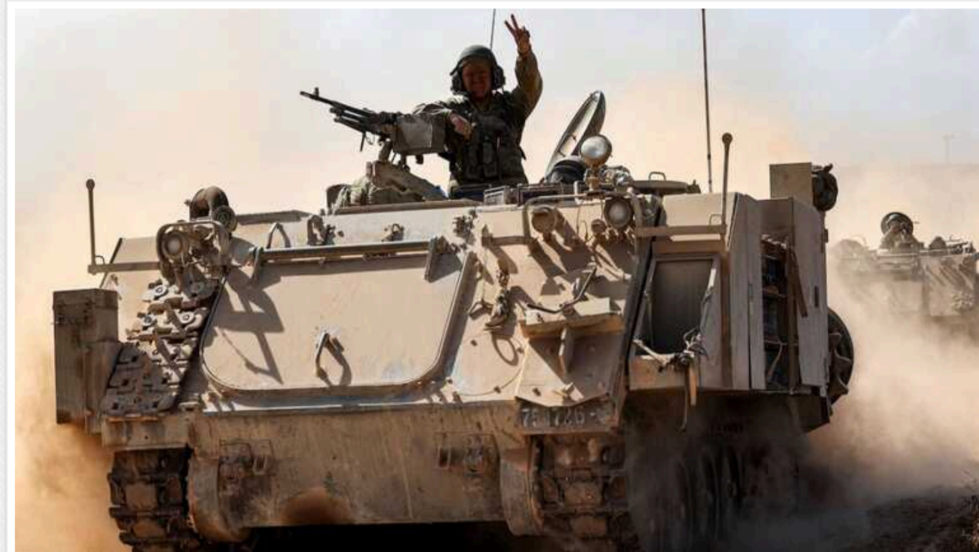
Блінкен: Наступ Ізраїлю на Рафах спровокує анархію, але не знищить ХАМАС

Повномасштабний наступ Ізраїлю на місто Рафах у Газі спровокує анархію, але не знищить ХАМАС. Вашингтон посилив кампанію тиску проти такого нападу.