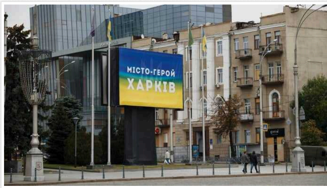
Із Харкова почали виїжджати сім'ї з дітьми, - місцевий житель