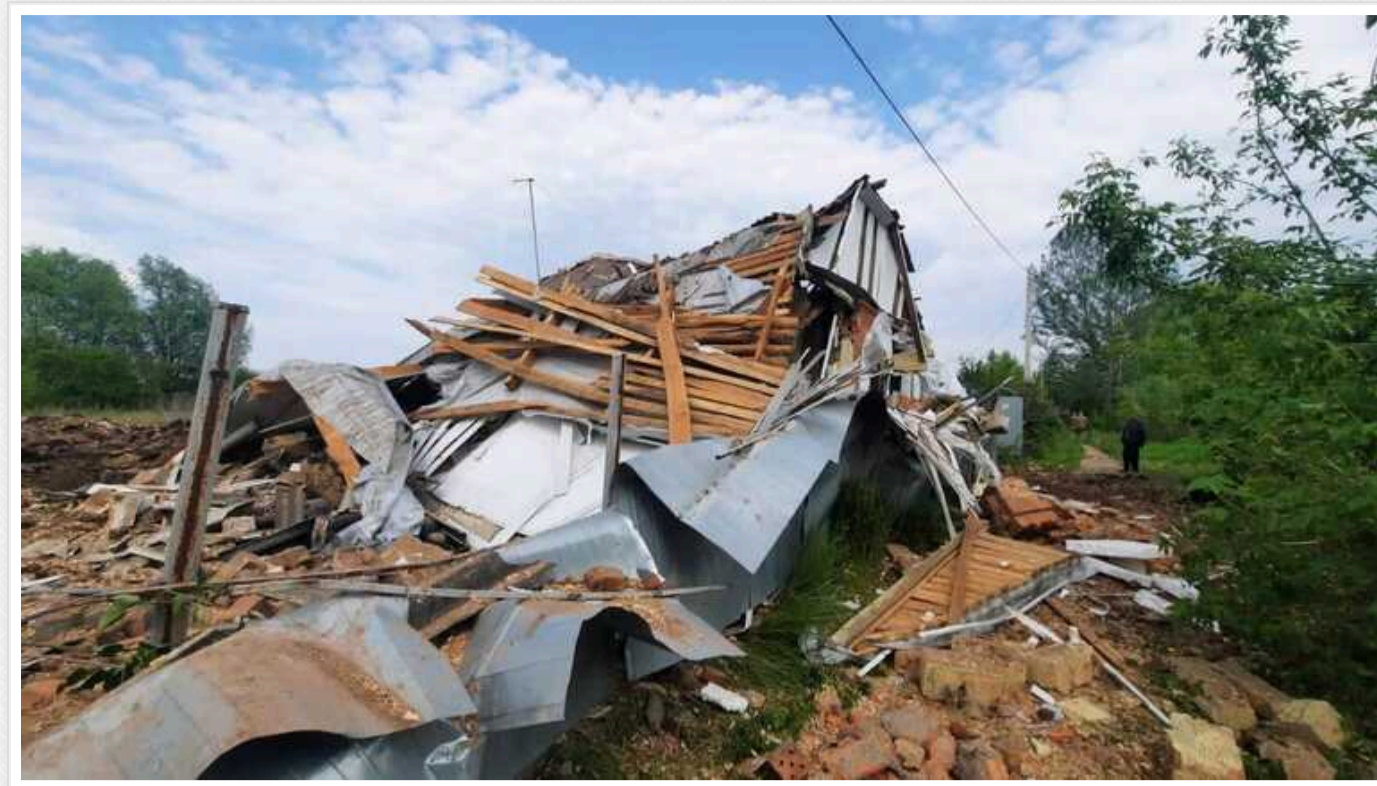
На Харківщині внаслідок обстрілів окупантами є загиблий і поранені

Унаслідок російських обстрілів прикордоння Харківщини 13 травня щонайменше одна людина загинула, ще четверо мирних мешканців поранено.