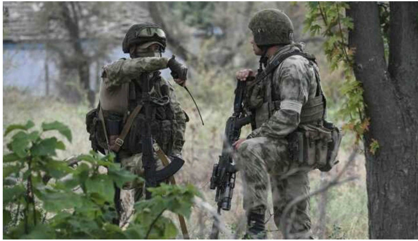
Армія РФ починає оточувати Вовчанськ з одного боку, – депутат Харківської обиради

За Вовчанськ тривають дуже складні позиційні бої, у ворога є просування.