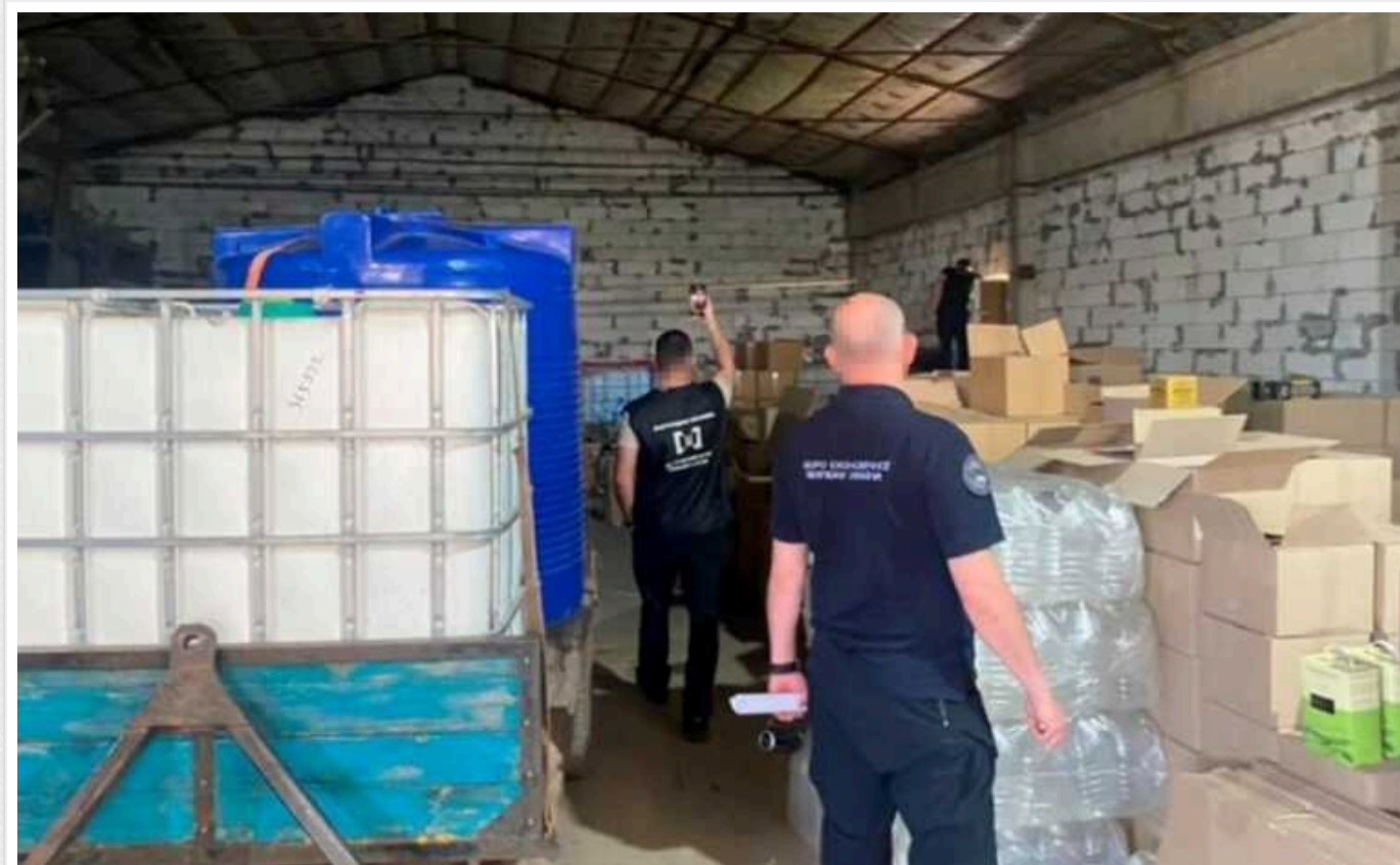
На Волині БЕБ викрило підпільний завод з виготовлення алкоголю

Детективи Головного підрозділу детективів Бюро економічної безпеки (БЕБ) викрили підпільне виробництво підакцизних товарів у місті Торчин Волинської області.