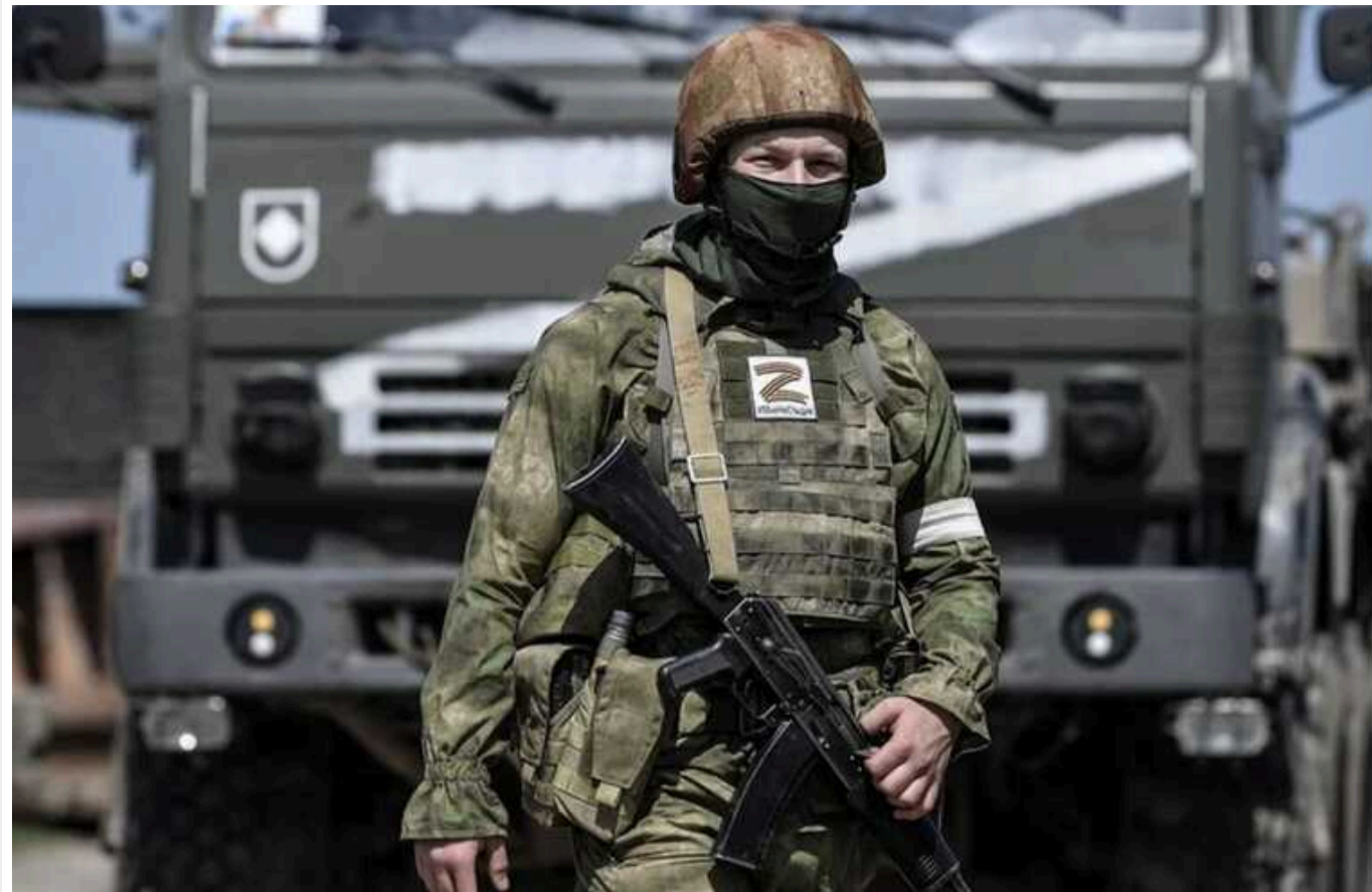
Кремль мотивує росіян йти на війну за обіцяні ділянки на окупованих територіях

Кремль обіцяє майбутнім загарбникам по 2 гектари окупованої української землі у Донецькій та Херсонській областях кожному. Головною умовою є вступ до лав армії РФ із подальшою їх відправкою на війну в Україну.