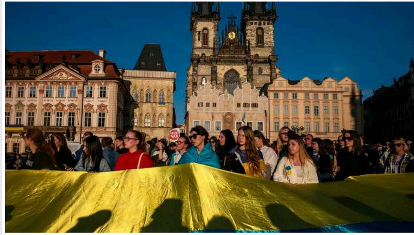
Скільки українських біженців у Німеччині, Польщі й Чехії вірять у перемогу України у війні, - опитування

Більшість українських біженців у Німеччині, Польщі й Чехії вірять, що у війні, яку розв'язала Росія, переможе Україна. Таких громадян 80%, із них 40% повністю впевнені в цьому, ще 40% – скоріше впевнені.