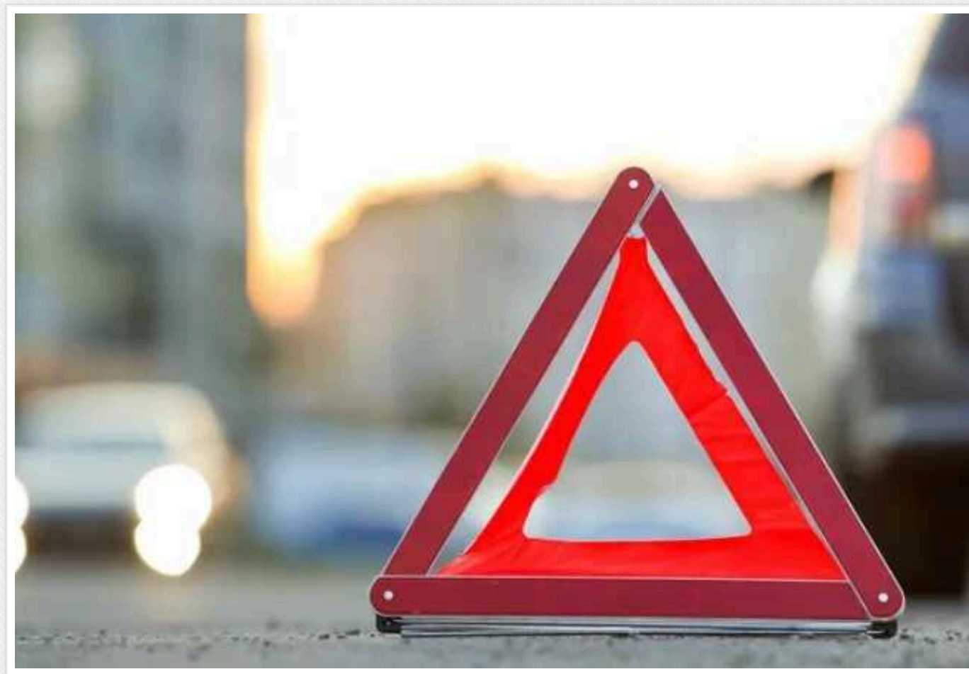
У Києві водій скутера напідпитку зіткнувся з мікроавтобусом

У Солом'янському районі Києва п'яний водій скутера Yamaha Jog виїхав на сусідню смугу, де зіткнувся із мікроавтобусом Volkswagen. Унаслідок ДТП 24-річний пасажир скутера, який не мав захисного шолома, отримав важку черепно-мозкову травму, за його життя борються лікарі.