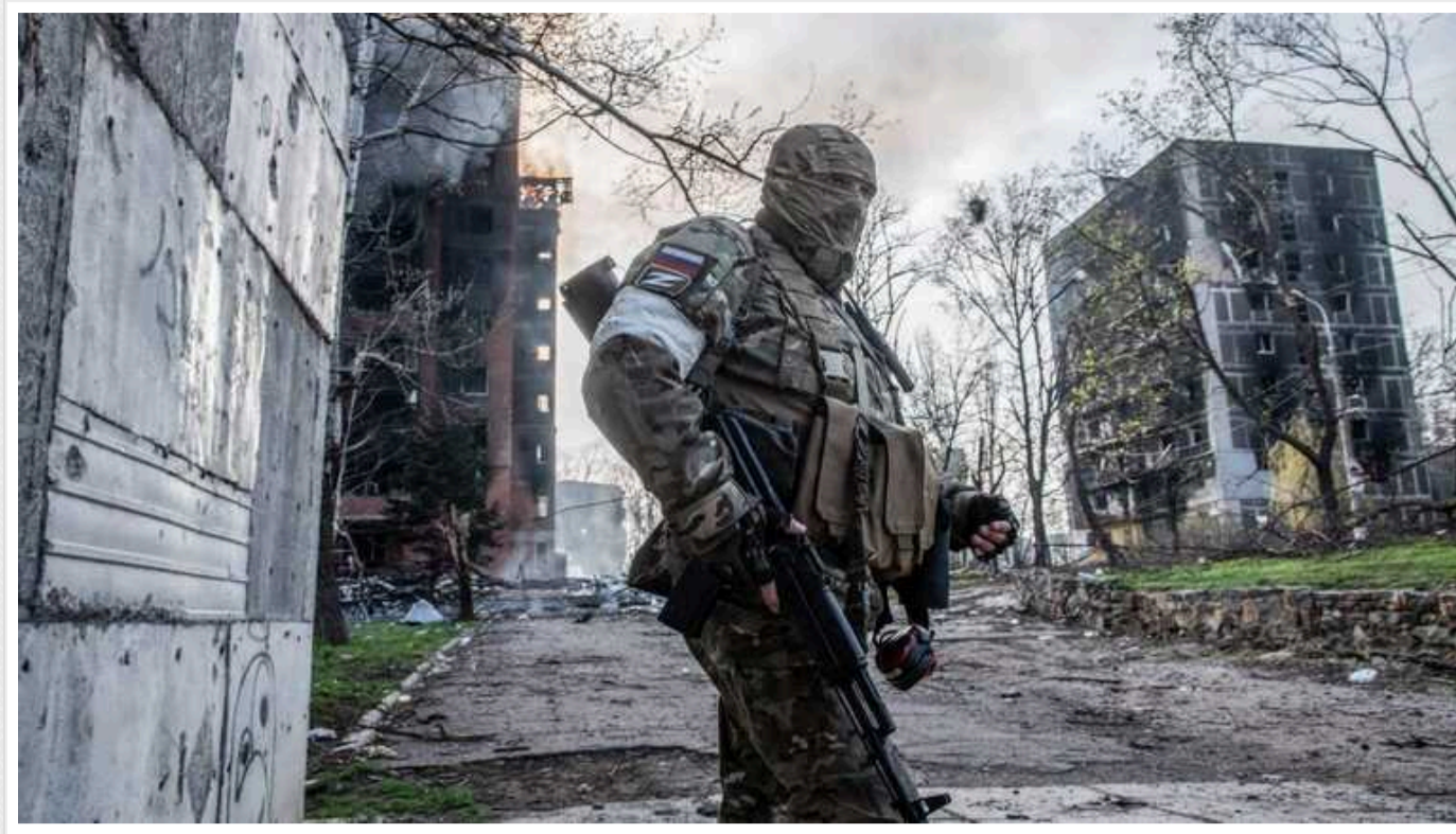
Російські війська у Харківській області намагаються розтягнути оборону ЗСУ, – ОВА

Російські війська у Харківській області «атакують невеликими групами по нових напрямках, намагаючись розтягнути оборону ЗСУ».