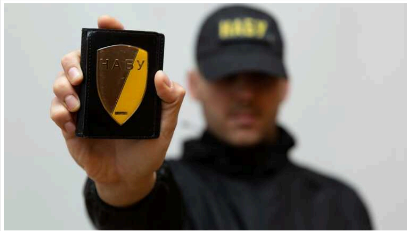
НАБУ оголосило у розшук ексголови Держгеокадастру Колотіліна та ще одного фігуранта Кацуна у справі Сольського

Національне антикорупційне бюро оголосило в розшук колишнього голови Держгеокадастру Олександра Колотіліна і ще одного фігуранта Сергія Кацуна у межах справи екміністра аграрної політики та продовольства Миколи Сольського. Дані містяться в розшукових обліках МВС.