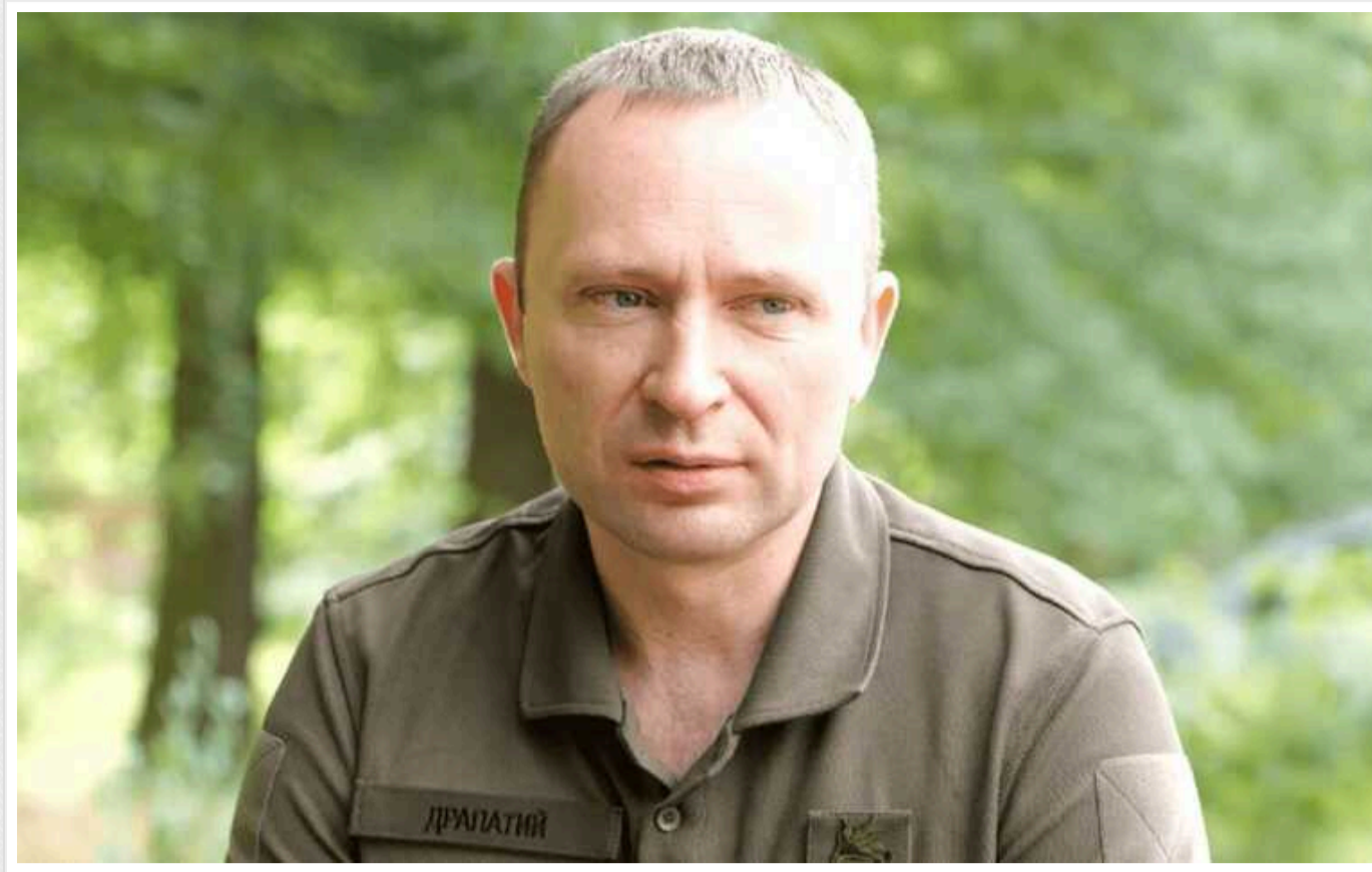
На тлі наступу в Харківській області змінили командувача ОТУВ "Харків"