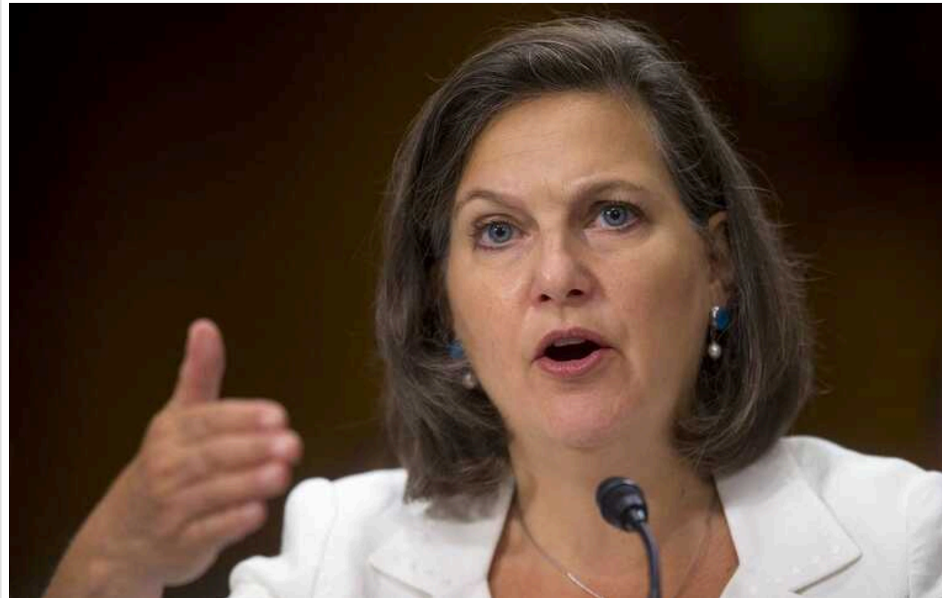
Військово-промислове співробітництво Китаю і РФ "рвонуло вгору", - Нуланд

Колишня заступниця держсекретаря Вікторія Нуланд заявляє, що військово-промислове співробітництво Китаю і РФ "рвонуло вгору", і Захід тисне на Пекін, щоб той припинив постачати Москві "нишком" компоненти для зброї.