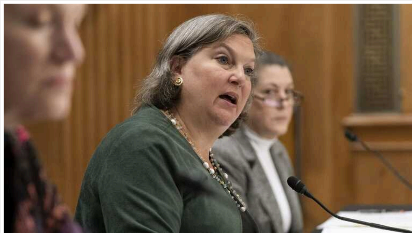
Вікторія Нуланд в інтерв'ю не відповіла, чи вірять у США в перемогу, де Україна вийде на кордони 1991 року

Заступниця держсекретаря США з політичних питань Вікторія Нуланд утрималася від відповіді, чи вважають у Вашингтоні можливою таку перемогу України, за якої вона поверне усі окуповані території.