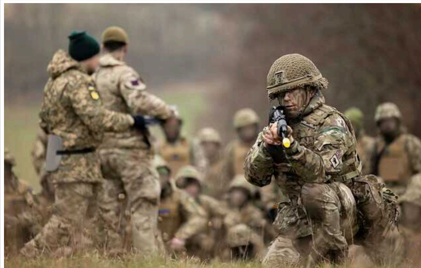
Наступ окупантів на кордоні Харківської області може посилити тиск на владу України з метою початку мирних переговорів, - NYT

The New York Times пише, що настанням РФ на кордоні Харківської області може посилити тиск на владу України з метою започаткування мирних переговорів.