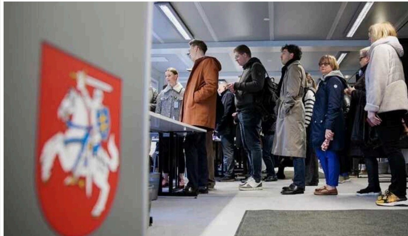
У Литві пройшли президентські вибори: у другий тур вийшли Науседа та Шимоніте

У Литві за результатами підрахунку голосів на першому турі президентських виборів до другого проходять чинний глава держави Гітанас Науседа, який балотується на другий термін, та прем'єр-міністр країни Інгріда Шимоніте.