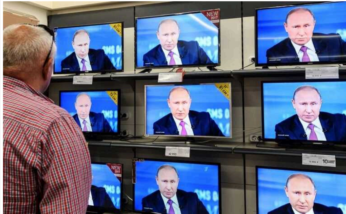
Кремль бореться з правдою та виправдовує війну проти України підробним «фактчекінгом»

Кремль використовує фактчекінг – перевірку фактів, ключову журналістську методику боротьби з фейками, щоб поширювати фейки та дезінформацію. Найбільшого поширення така практика прокремлівських медіа набула саме після початку повномасштабного вторгнення Росії в Україну у лютому 2022 року.