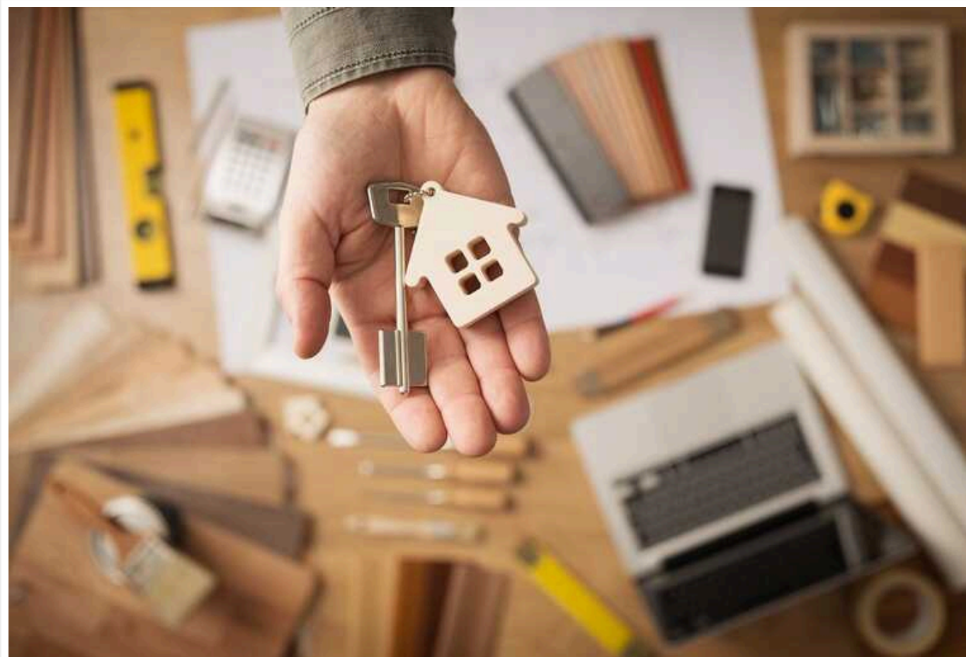
Онлайн-шахраї в Україні: здають в оренду неіснуючі квартири

Україна стикається з рекордною кількістю справ щодо шахрайства. Судовий реєстр України налічує щонайменше 42 тисячі вироків за цим злочином, з яких понад 360 пов'язані з шахрайством з нерухомістю. Однією з таких схем є здача в оренду неіснуючих квартир.