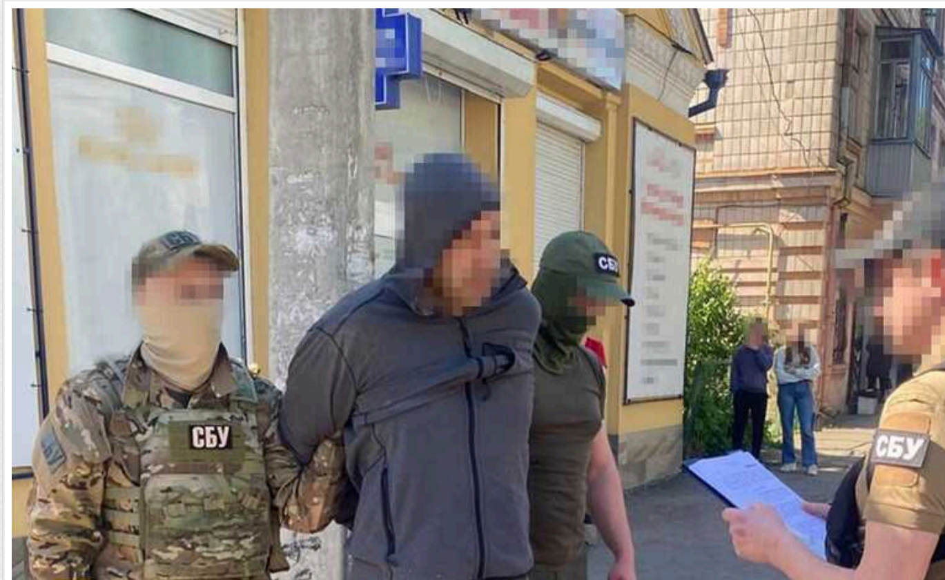
СБУ затримала агента ФСБ: готував ракетні удари по Рівненщині

Служба безпеки запобігла серії ракетно-дронових ударів агресора по військовій та критичній інфраструктурі Рівненщини.