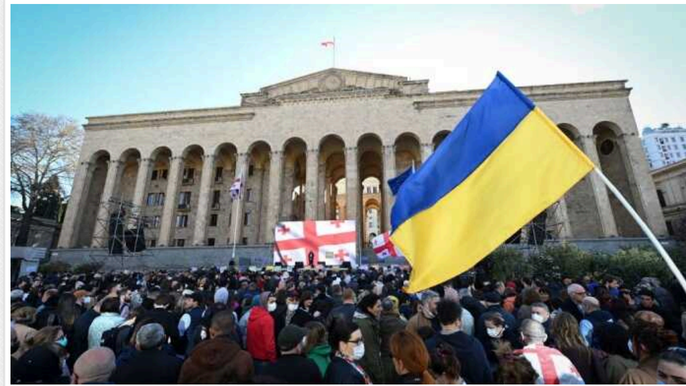
Комітет парламенту Грузії підтримав законопроект про «іноагентів»

Комітет з юридичних питань парламенту Грузії стрімко підтримав у третьому читанні скандальний законопроект про "іноагентів".