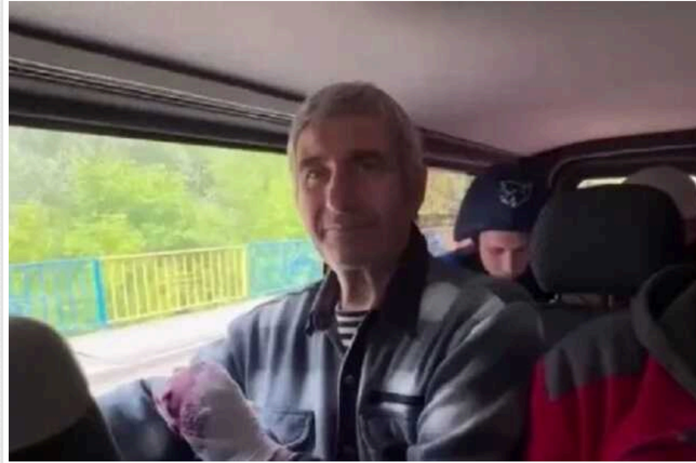
Біля Вовчанська російські військові відстрілили палець мирному жителю

У неділю, 12 травня, близько 12:30 на околицях міста Вовчанськ Харківської області російські військові відстрілили палець 74-річному місцевому мешканцю.