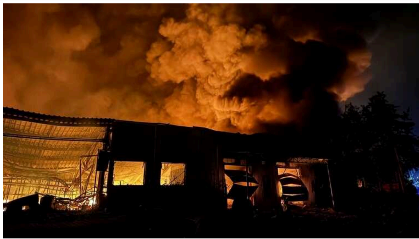
Ворожі бомбардування України стали більш смертоносними, ніж будь-коли, – Wall Street Journal

The Wall Street Journal пише, що російські бомбардування України стали більш смертоносними, ніж будь-коли.