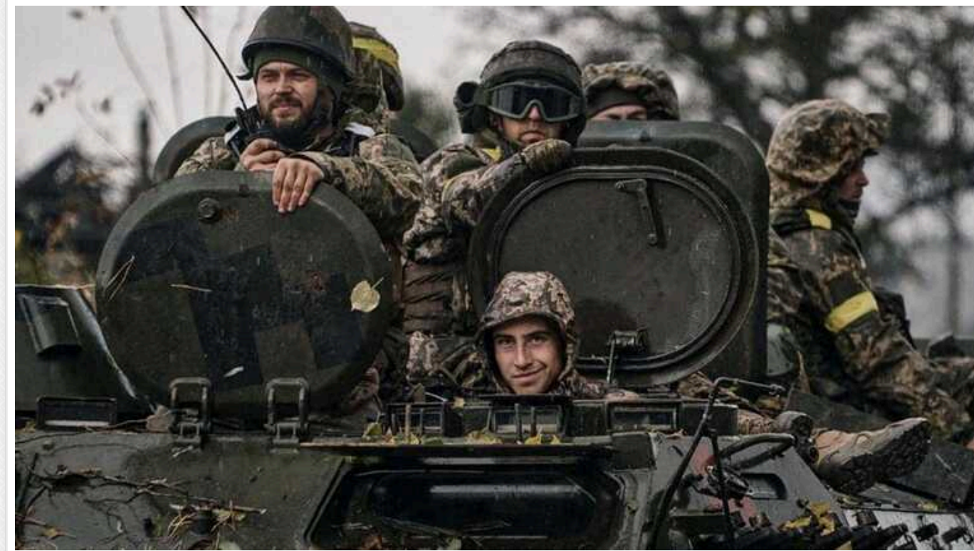
Ситуація на фронті: протягом доби зафіксовано 146 бойових зіткнень

У неділю на фронті сталося 146 боєзіткнень, зокрема на Харківському напрямку росіяни здійснили 10 атак в районах населених пунктів Лук'янці, Глибоке, Вовчанськ, Бугруватка Харківської області.