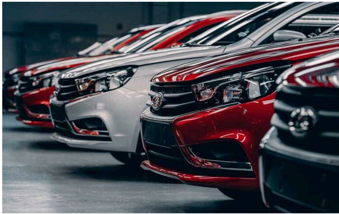
Залучення транспортних засобів під час мобілізації здійснюється ТЦК або регіональними органами СБУ, – Міноборони