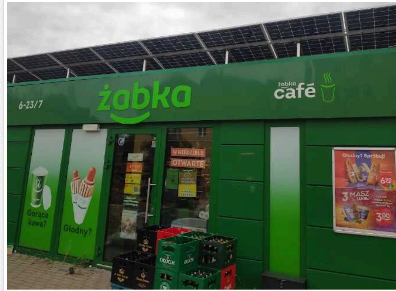
У Польщі експліцейський заборонив українцям говорити рідною мовою у своїй крамниці

У Польщі Центр моніторингу расистської та ксенофобської поведінки повідомили у районній прокуратурі Тщанки про те, що колишній поліцейський підозрюється в образах та погрозах за національною ознакою.