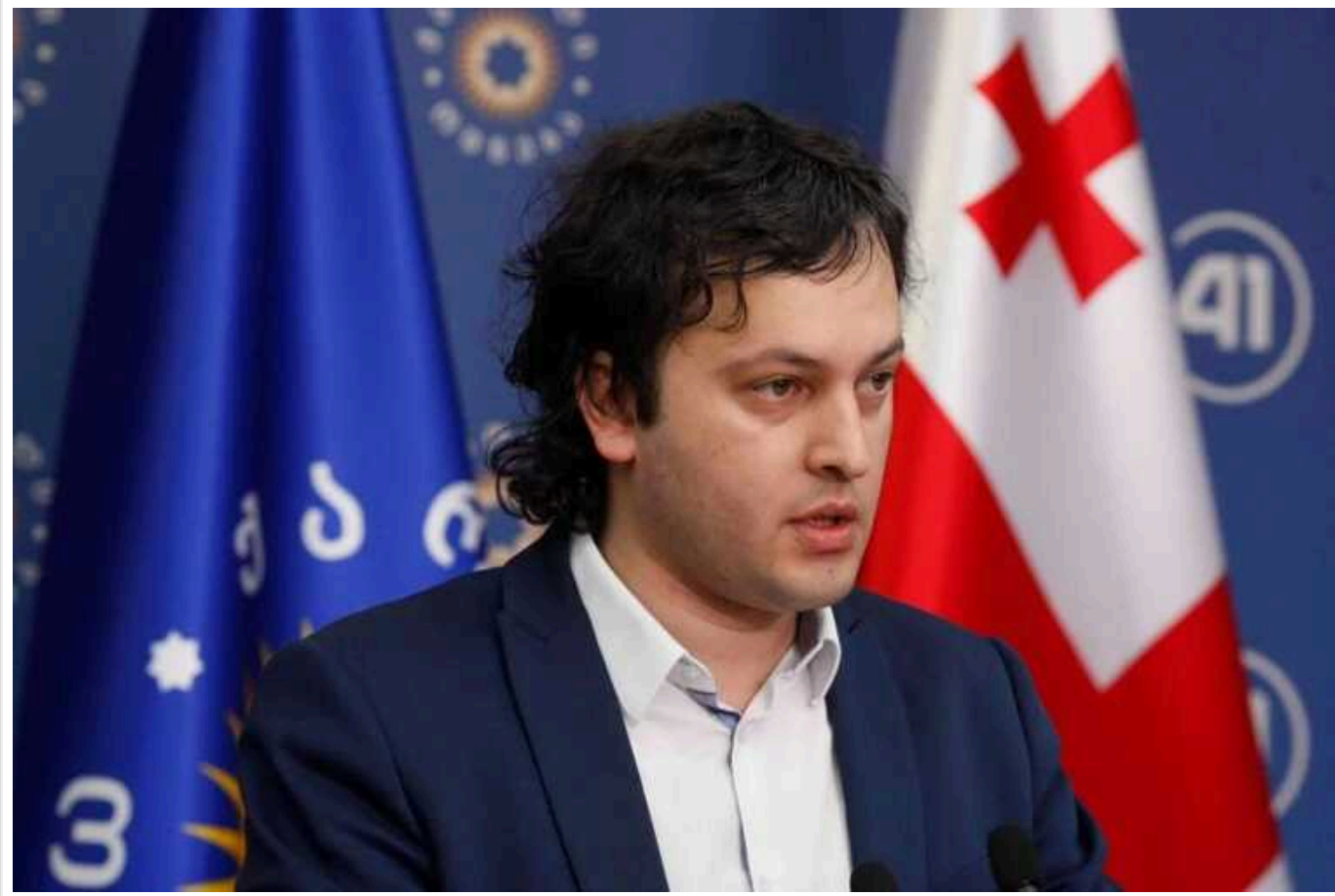
Прем'єр Грузії обіцяє наступного тижня ухвалити законопроект про "іноагентів"