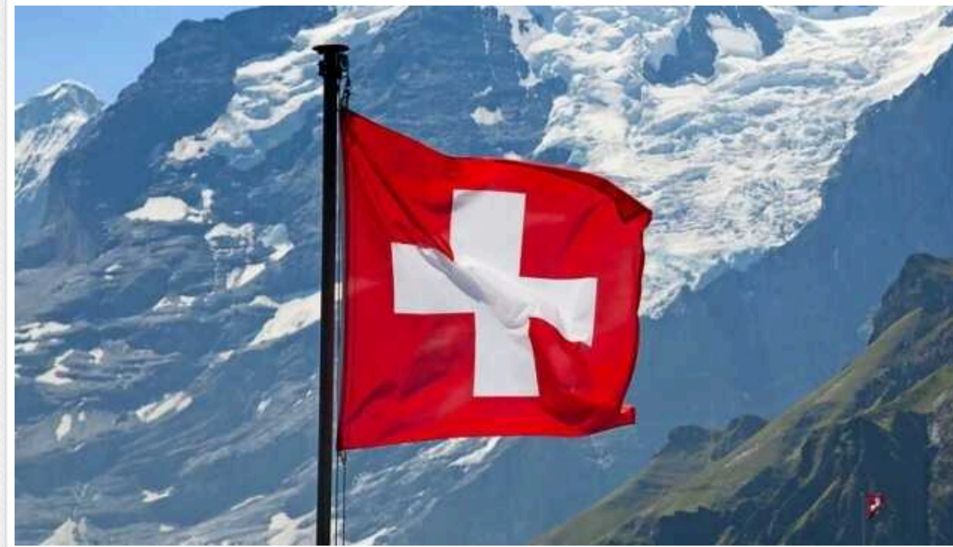
У Швейцарії політики налаштовані повернути до України 11 000 чоловіків – ЗМІ