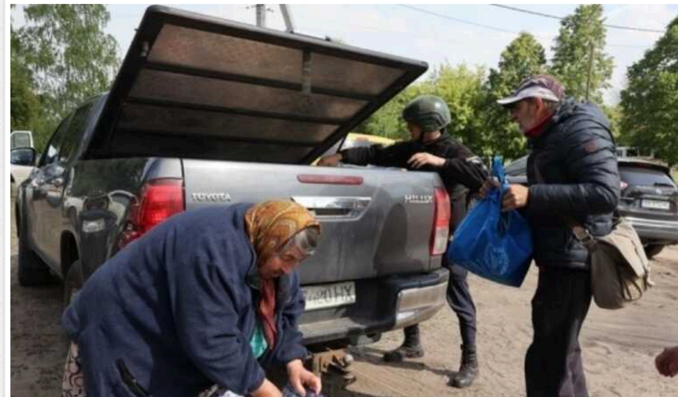
За день із Вовчанська та найближчих громад евакуювали 1600 людей – ОВА

У неділю з Вовчанського напрямку на Харківщині евакуювали 1600 людей, за кілька днів із Харківського району та Вовчанської громади вивезли майже 6 тисяч жителів.