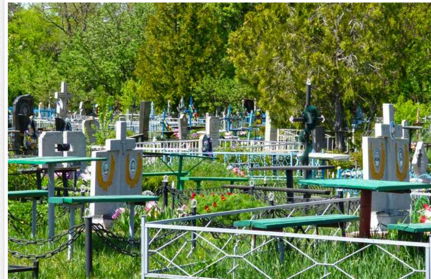
Загарбники на окупованих територіях заборонили жителям відвідувати кладовища у поминальний понеділок

На тимчасово окупованих територіях росіяни заборонили людям відвідувати кладовища у поминальний понеділок.