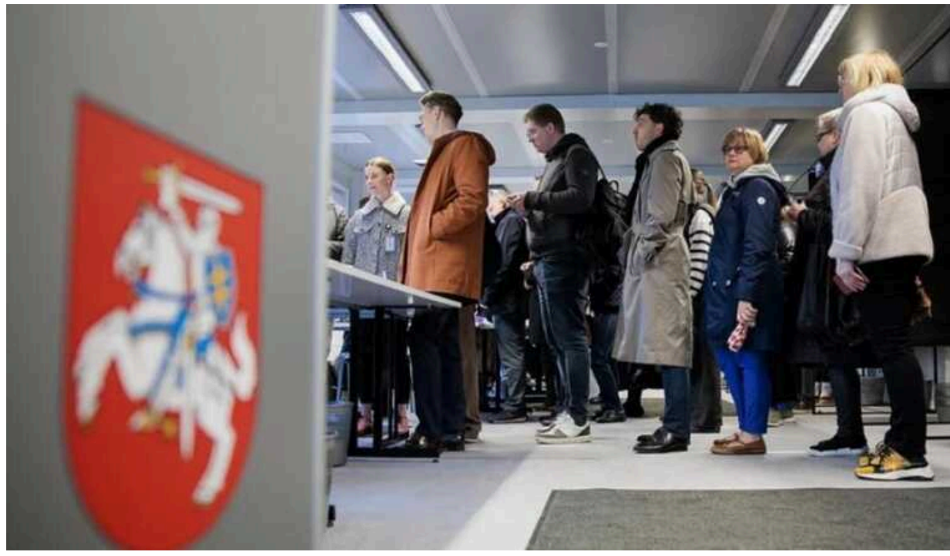
У Литві завершилося голосування на виборах президента

У Литві завершилося голосування на президентських виборах, а також на референдумі стосовно легалізації множинного громадянства.