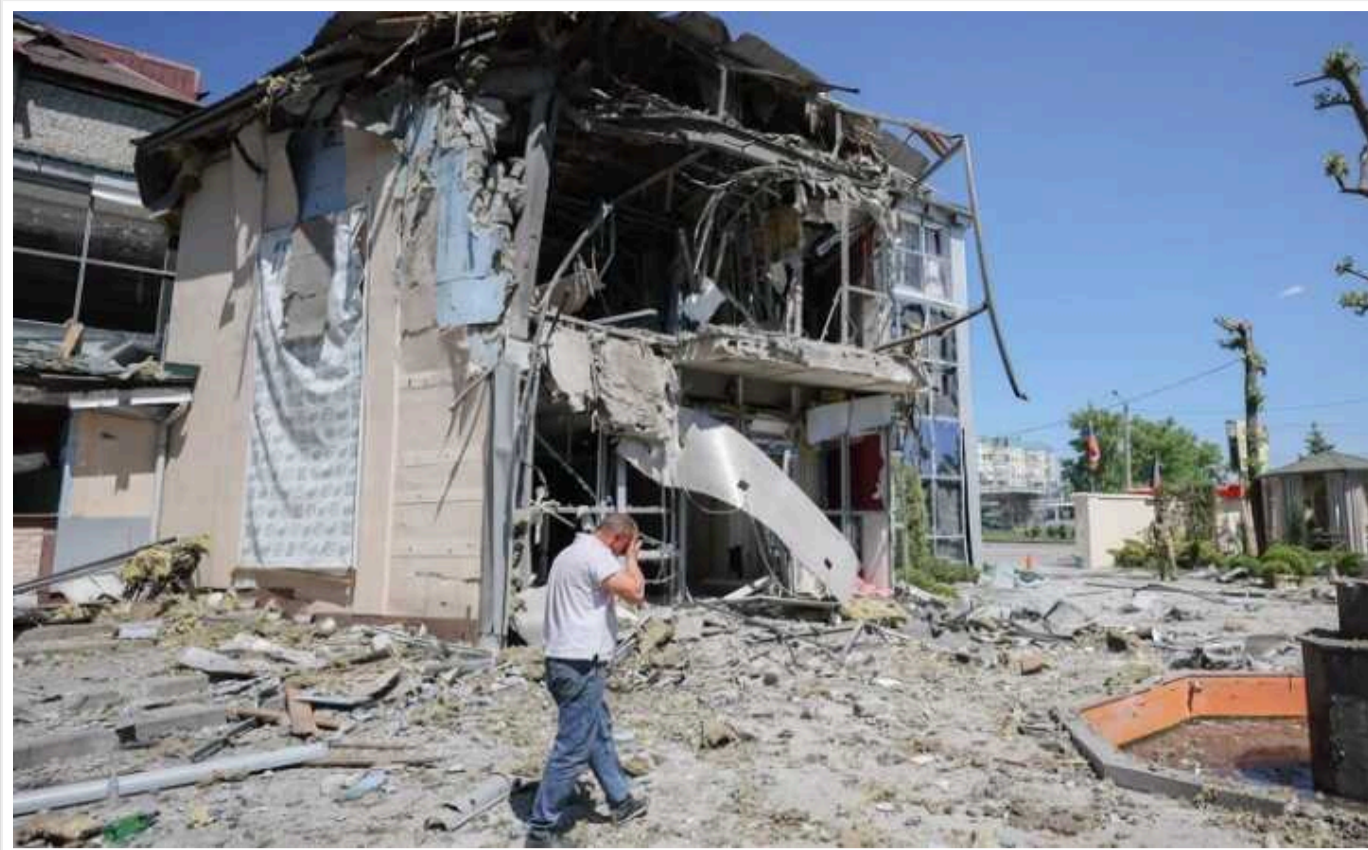
Стали відомі прізвиська ліквідованих окупантів у донецькому ресторані Paradise

У тимчасово окупованому Донецьку 11 травня прогрімлі вибухи. Вже 12 травня стали відомі перші прізвиська ліквідованих після удару по ресторану Paradise росіян, офіцерів ГУ Генштабу РФ.