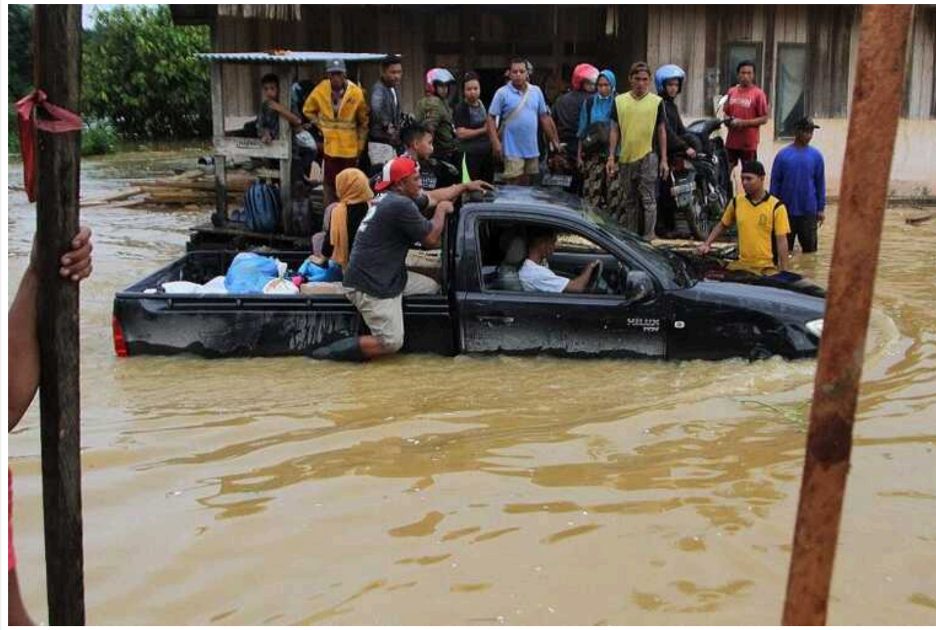
В Індонезії через повені та зсуви ґрунту загинуло 28 осіб

Повені та зсуви ґрунту, спричинені зливами, забрали життя 28 людей в індонезійській провінції Західна Суматра, ще чотири особи вважаються зниклими безвісти.