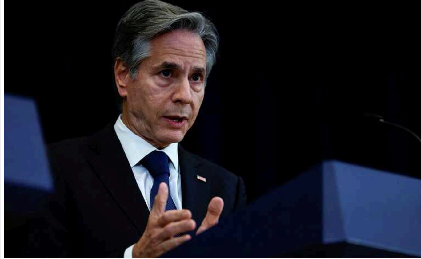
У Держдепі США переконані, що Україна може утримувати лінію фронту на сході

Держсекретар США Антоні Блінкен переконаний, що українські військові зможуть ефективно утримувати лінію фронту на сході попри намагання Росії вести наступальні дії.