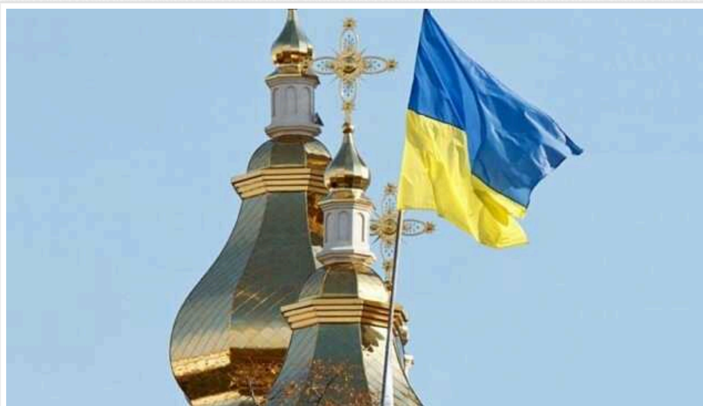
ПЦУ підтримує необхідність законодавчої заборони УПЦ МП

Православна церква України підтримує необхідність запровадження законодавчої заборони підлеглості релігійних організацій в Україні релігійним об'єднанням з центром у державі-агресорці та звертається до ВР з проханням підтримати відповідний урядовий законопроект.