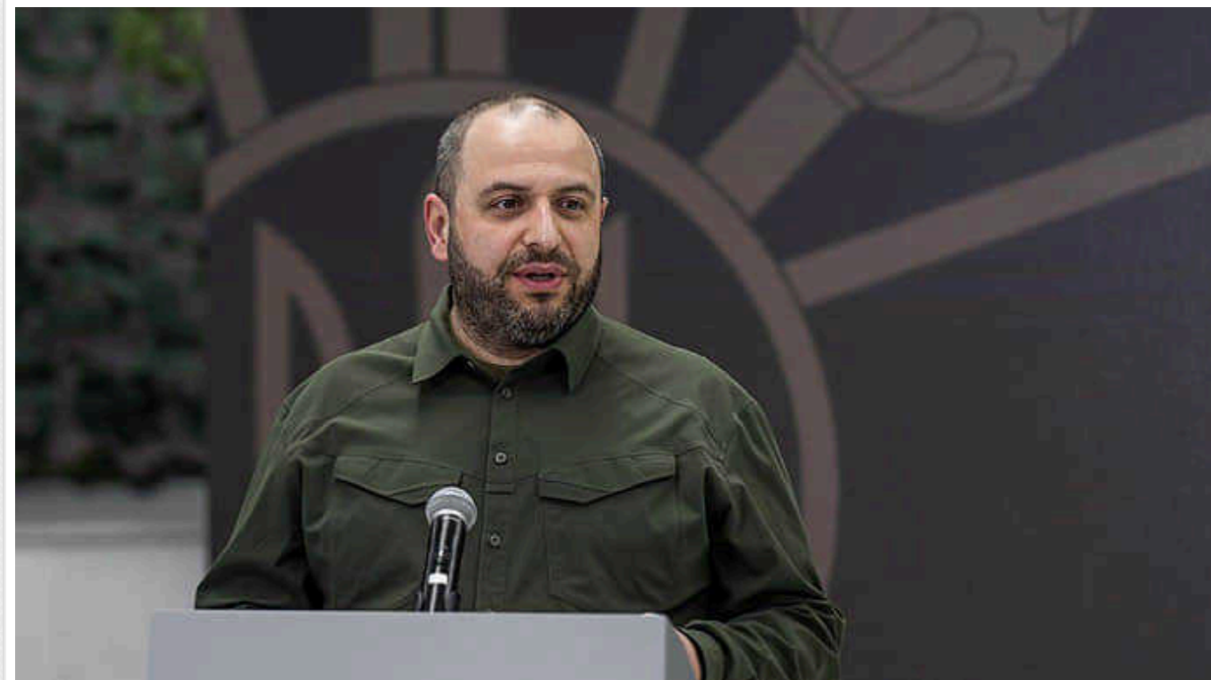
У Мінборони розповіли, які вакансії найпопулярніші в центрах рекрутингу

У центрах рекрутингу до Збройних сил, відкритих у різних областях України, найбільший попит мають вакансії водіїв, механіків або операторів безпілотників.