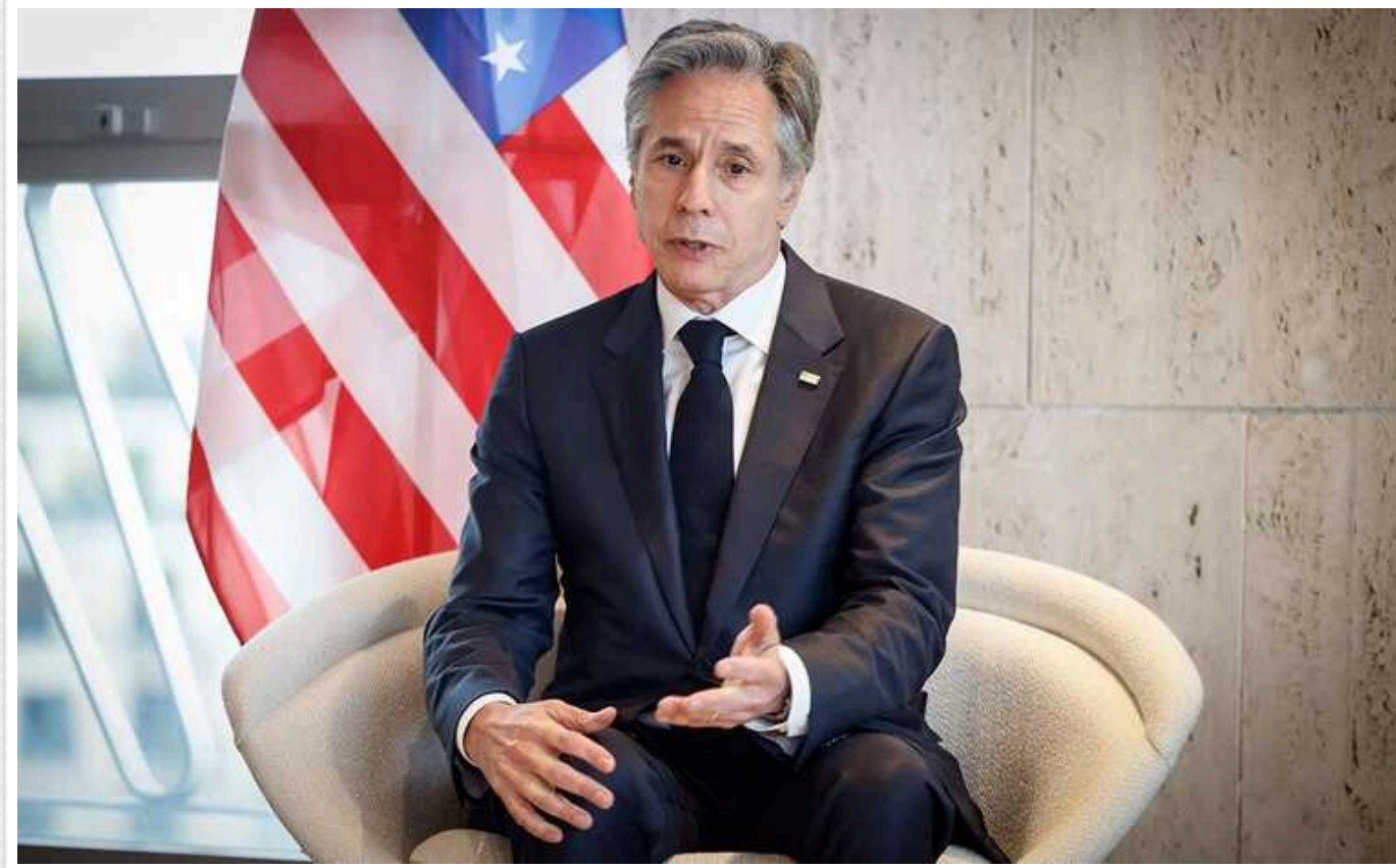
Робимо все можливе. Ми нікуди не йдемо, - Блінкен про терміни надання військової допомоги Україні

США роблять усе можливе, щоб прискорити військові постачання Україні, в тому числі для створення загрози Криму, і впевнені, що вона може втримати фронт "на сході".