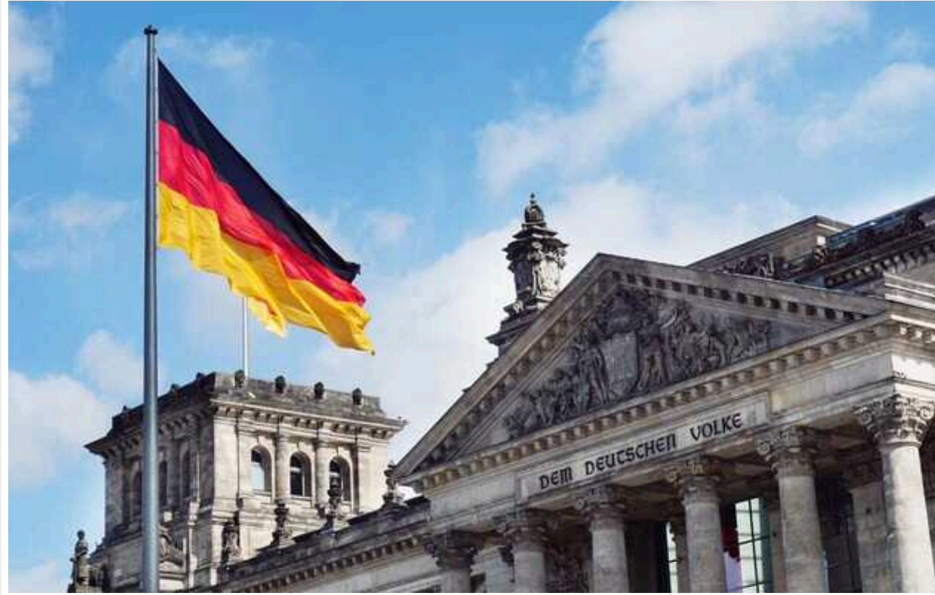
У німецькому уряді виникла суперечка через додаткові кошти на армію

Між міністром фінансів Німеччини Крістіаном Лінднером та главою міністерства оборони країни Борисом Пісторіусом назріває конфлікт через небажання першого виділити більше грошей на утримання армії.