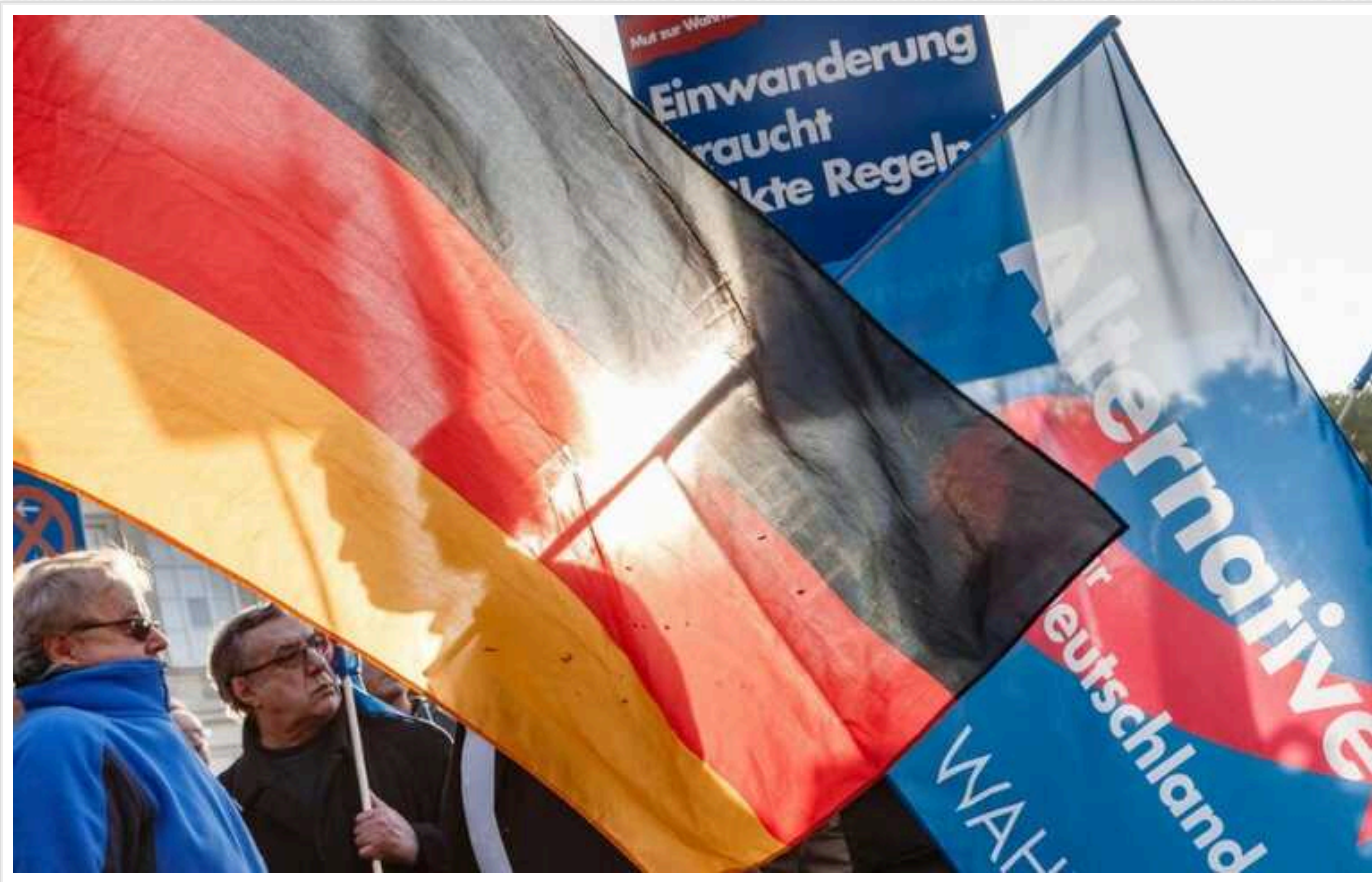
У Німеччині підтримка ультраправих впала до річного мінімуму

Рейтинг ультраправої партії "Альтернатива для Німеччини" ("АдН") знизилася до 17 відсотків.