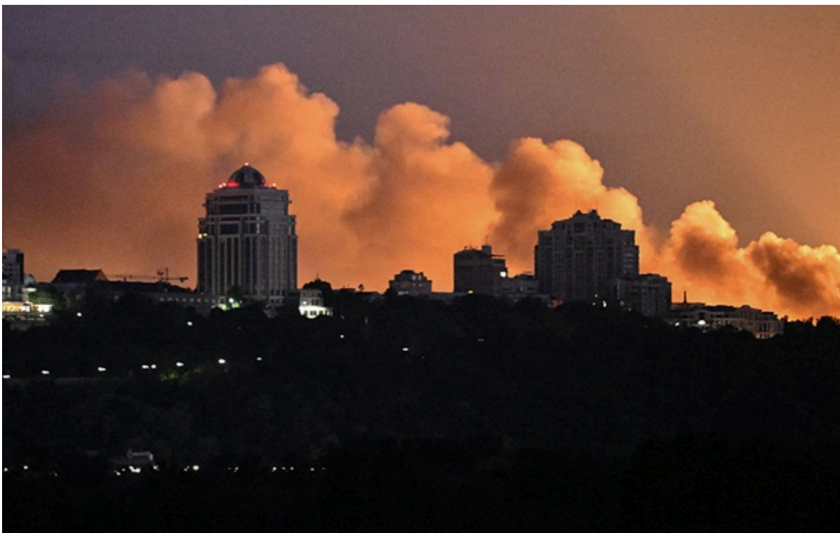
Атака на Київ 24 травня