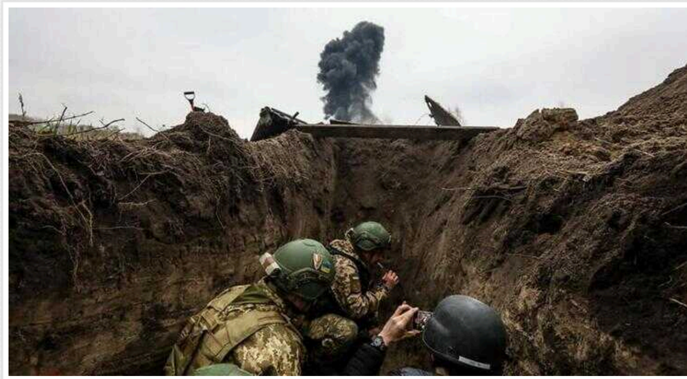
Окупанти зосереджують свої зусилля на двох напрямках на півночі Харківщини

Про це повідомив в ефірі телемарафону «Єдині новини» речник Оперативно-стратегічного угруповання військ «Хортиця» Назар Волошин.