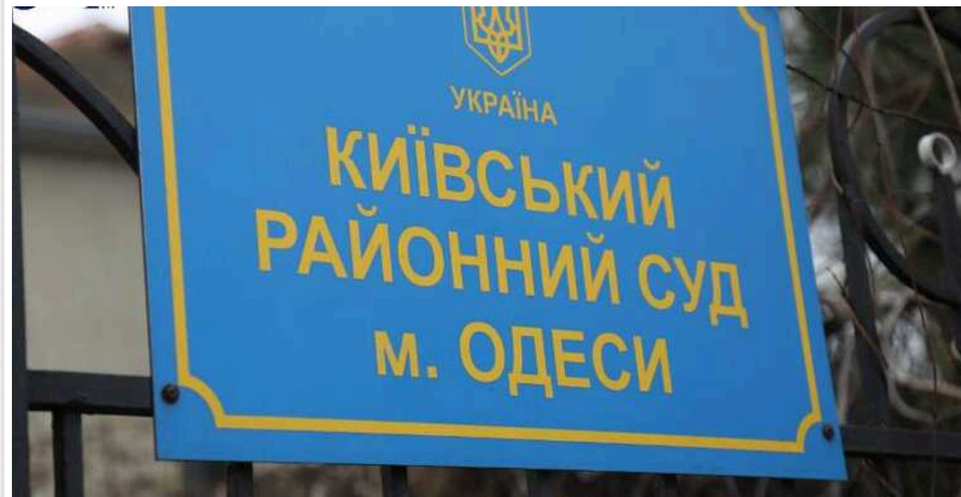
Одесит донатив окупантам й отримав лише умовний термін

Київський райсуд Одеси засудив до п'яти років позбавлення волі з трирічним випробувальним терміном мешканця міста, який у 2022 році систематично перераховував гроші на допомогу ворожим збройним формуванням.