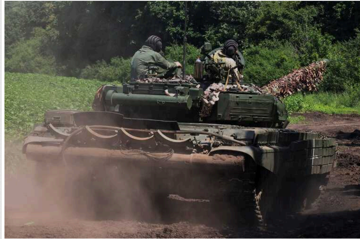
Росія на Харківському напрямку перекидає резерви та застосовує значні сили піхоти та бронетехніки

На Харківському напрямку Збройні сили України проводять контрударні операції в районах прикордонних сіл, таких як Стрільча, Красне, Мороховець, Олійникове, Лук'янці, Гатище і Плетенівка. Водночас ворожі сили перекидають сюди резерви та залучають значну кількість піхоти, бронетехніки та різних видів дронів.