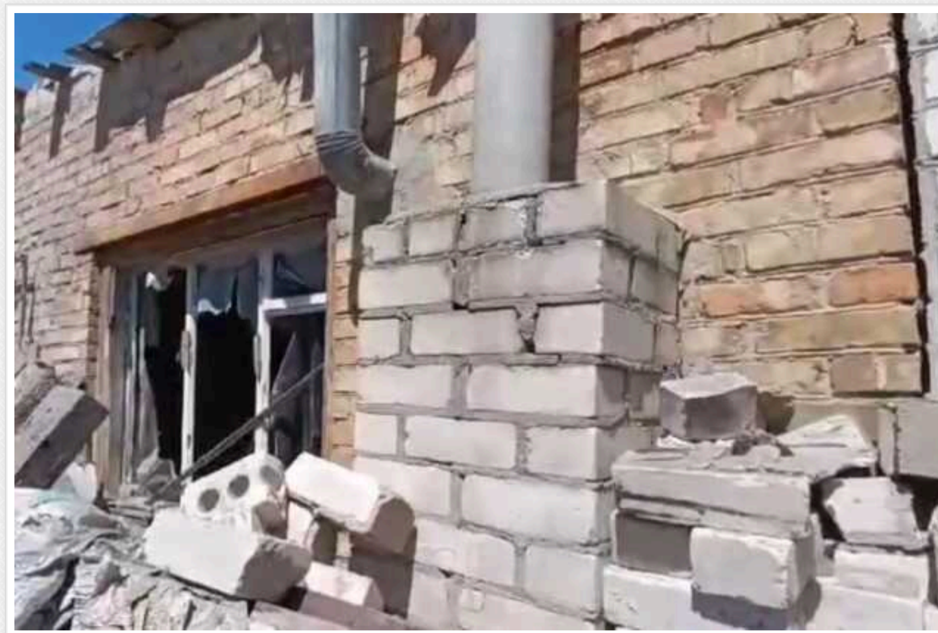
Окупанти обстріляли Корабельний район Херсона

Військові Росії вранці в неділю, 12 травня, завдали удару по Корабельному району Херсона. Під обстріл потрапили житлові квартали міста.