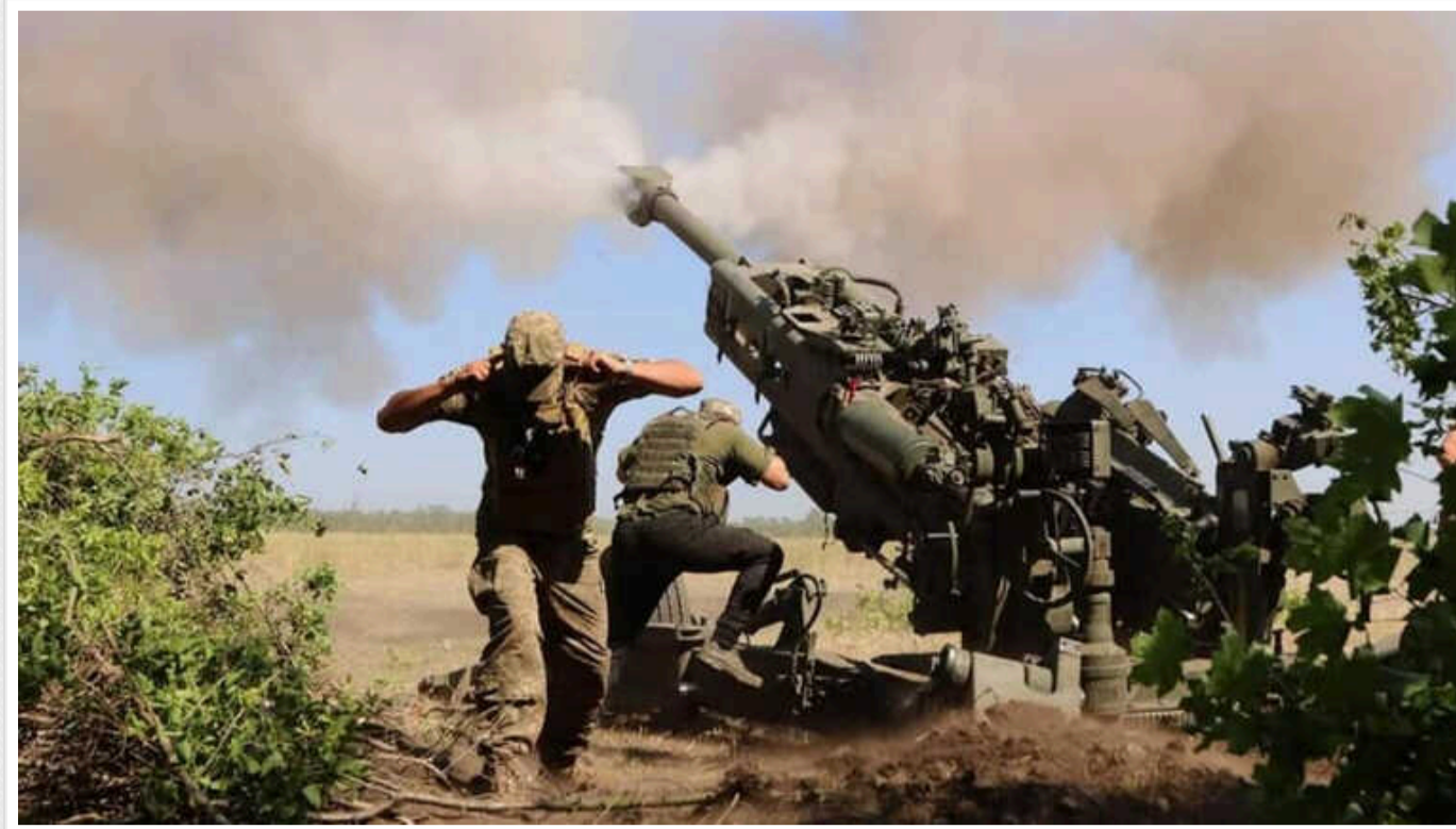
Збройні сили у Красногорівці відрізали загарбників на вогнетривкому заводі - вони без БК та підтримки, - ОСУВ "Хортиця"

У Красногорівці Донецької області росіяни заховалися у залишках вогнетривкого заводу, вони відрізани від постачання боекомплекту та підтримки бронетехніки. Місто контролюється захисниками 59-ї окремої механізованої бригади