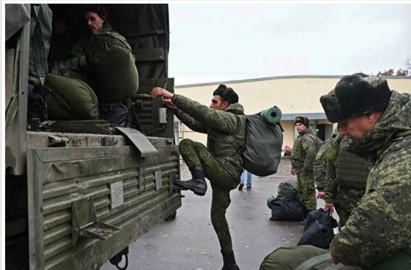
РФ залучає африканських найманців до бойових дій на Харківщині, - партизани

Росія залучає найманців із африканських країн у наступі на Харківську область. Росіяни посилають їх у передові загони, знаючи, що більшість із них не повернуться зі штурмів.